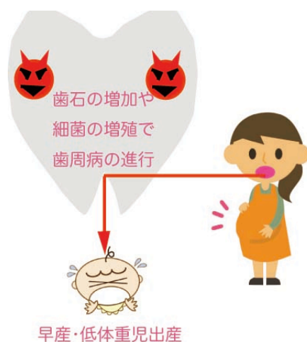
図 1 大切な妊娠中の歯周病予防

図 1 のように、妊娠中はホルモンの変化やつわりなどで食習慣も乱れ、口の中は汚れやすく、歯と歯ぐきのトラブルが多くなりがちです。けれども、おなかの赤ちゃんへの悪影響を考えると十分な歯科治療はしづらくなります。ですから当然、妊娠前からの歯科健診が重要なのですが、更に妊娠中の歯と歯ぐきを健やかに保つために、この健診の意義があります。